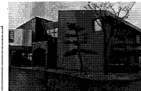
〈産業技術センター本館〉 昭和57年建築、RC造2階建

・技術指導や相談機能の充実、異業種間の連携などによる県内産業の基盤強化に向けて施設を再配置するなど、集約・複合化を検討する。 ・また、効率的な管理を前提とした最適な施設構成を実現するため、老朽化した附帯的な施設を中心に集約・複合化を検討する。