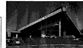
〈県立体育館〉 昭和43年建築、RC造3階建

・民間サービスへの代替性が高い施設は、民間等への譲渡を進めるとし、譲渡できない場合にあっては建替えを実施しない。 ・県内での代替性がない施設については、利用状況等を踏まえ、長寿命化を含めた戦略的な対策を実施する。