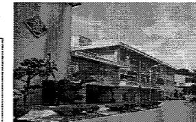
〈能代工業高等学校 校舎〉 昭和43年建築、RC造4階建

・高等学校については、総合整備計画に基づき、統合整備等を推進する。 ・統合整備等により生じた余剰施設は、県民ニーズを捉えつつ転用を図るなど、地元と連携しながら利活用を推進する。 ・教育機関については、類似した機能を持つ施設の集約・複合化などを検討する。