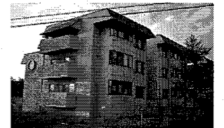
〈県営獅子ヶ森住宅〉 昭和58年建築、RC造3階建

・原則、長寿命化を図っていくが、耐用年数の経過後は、老朽度や需要等を踏まえ、建替えや用途廃止などを検討する。 ・市町村営住宅を含めた管理運営の課題について、県と市町村が協働しながら検討する。