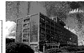
〈秋田県庁舎〉 昭和34年建築、RC造6階建

・庁舎等については、オフィススタンダードの推進により、空きスペース等を確保しながら、施設の集約・複合化を検討する。 ・著しく老朽化した施設などは廃止のうえ、民間施設等の借上などにより執務スペースを確保する。