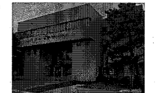
〈旧議員会館〉 昭和55年建築、RC造3階建

・旧議員会館については、既にサービスを廃止しているが、ハード面において一定の健全性を保持し、今後の利活用が見込めることから、他の施設に先行して個別施設計画を策定する。 ・利活用策については、警察本部が、機動捜査隊の移転など犯罪捜査基盤の集約化による初動捜査体制の強化を図るため、旧議員会館を行政組織（警察）に用途を転用する。