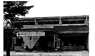
〈南部老人福祉総合エリア〉 昭和63年建築、RC造2階建

・民間サービスへの代替性の高い施設を中心に、民間等への譲渡を実施するが、原則、これまでと同様の事業を継続する。 ・特に民間等とサービスが競合すると認められる施設については、民間等への譲渡を基本とするが、譲渡できない場合にあっては建替えを実施しない。 ・公益性の高いサービスを提供する施設は存続とし、民間等への譲渡を実施しない。